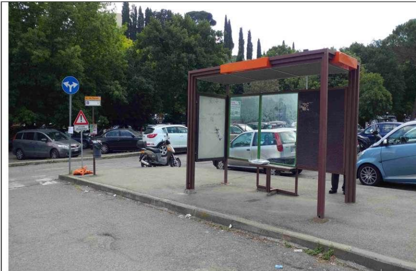
1- Pensilina dentro Presidio Ospedaliero P. Palagi