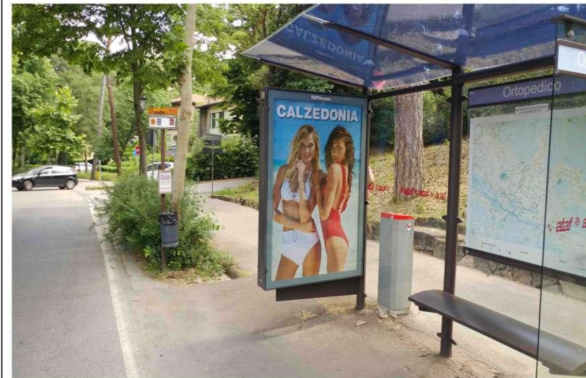
3- Pensilina fermata linea 12 – Viale Michelangiolo (pressi n.civico 41) Ingresso Presidio Ospedaliero P. PALAGI